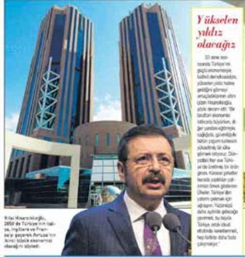
Rifat Hisarcıklıoğlu, 2050'de Türkiye'nin ilk 10 ekonomisi arasında yer alacağını vurguladı. Türkiye'nin 2050'ye kadar dünyada ilk onu zorlayacak noktaya geleceğine inanarak sözlerine devam etti.

İktisatçı kuruluşta, yapısal reformlara devam ettiği takdirde Türkiye'nin potansiyelini parlayacak bir geleceğe sahip olacağı vurgulayan Hisarcıklıoğlu, Türkiye'nin 2050'ye kadar dünyada ilk onu zorlayacak noktaya geleceğine inanarak sözlerine devam etti. Hisarcıklıoğlu, "Türkiye bugün dünyanın 17'nci büyük ekonomisi olarak 2050'de 12'nci, 2060'de ise dünyanın 10'uncu ekonomisi olacaktır. 2050 yılında Türkiye'nin nüfusu 100 milyon olacaktır. Japonya, İngiltere ve Fransa'nın geride bırakarak dünyanın 2'nci büyük ekonomisi olacaktır" diye konuştu.