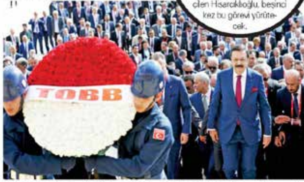
TOBB Genel Kurulu öncesi, TOBB heyeti Rifat Hisarcıkıoğlu öncülüğünde Anıtkabir'i ziyaret etti.

Hisarcıkıoğlu, "Ülkemizi hak ettiği yere çıkarmak için, iş dünyası daha hızlı koşmak zorunda. İş dünyasının hızlı koşabilmesi için de, bizim önden gidip, yolu açmamız gerekiyor" dedi.