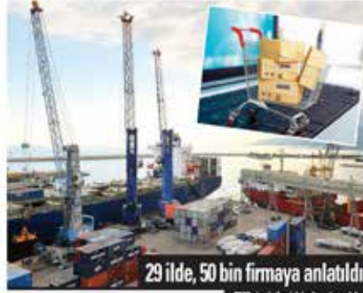
29 ilde, 50 bin firmaya anlatıldı

Türkiye e-ticaret pazarı 'güven damgası' uygulamasıyla büyüyor. TOBB Başkanı Rifat Hisarcıklıoğlu uygulamanın özellikle yurtdışı pazarlarına açılmak isteyen Türk KOBİ'lerin önünü açacağına dikkat çekti.